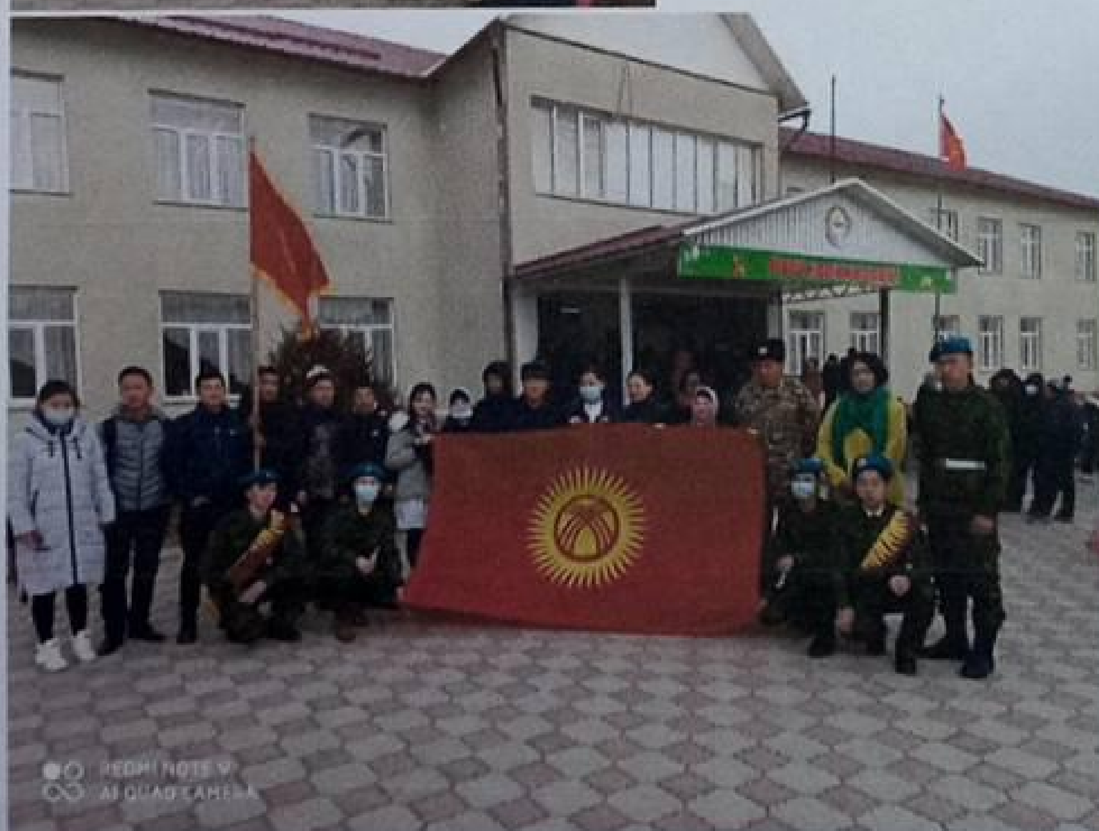
15-февраль «Апаттуу ооган согушу» болгон иш чара